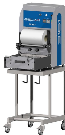
Table support inox304L sur roulettes (2 roulettes freins) équipée de 2 crochets permettant de ranger les matrices.